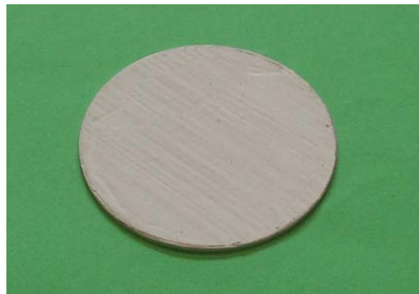
Figura 2. Esempio di Provino

A partire dai campioni di Figura 1, sono stati realizzati i provini, di cui si riporta un esempio in Figura 2, mediante le seguenti operazioni eseguite in successione: carotatura con mola a tazza, cilindatura al tornio parallelo per realizzare la finitura sulla dimensione diametrale ( 50.8 \pm 0.25mm ) secondo la norma 2-d, mentre non si è resa necessaria la spianatura con rettificatrice verticale a disco. Di seguito si è condizionato il materiale in stufa ventilata a 50°C per 24 h per raggiungere lo stato essiccato come richiesto dalla norma 2-c.